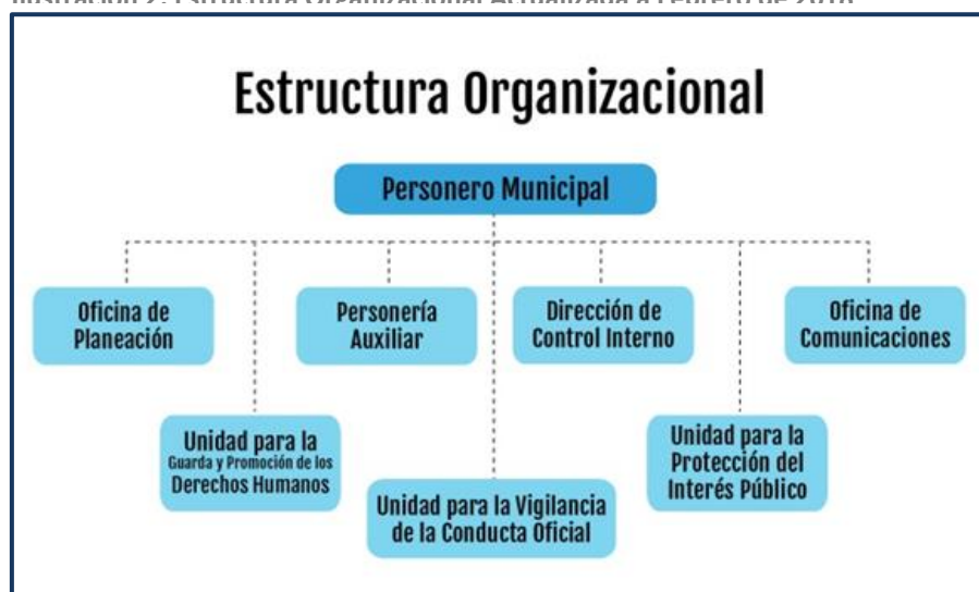
Ilustración 2. Estructura Organizacional Actualizada a Febrero de 2018

En el presente periodo de evaluación no se ha realizado ningún cambio a la Estructura Organizacional; continua vigente el organigrama actualizado en la página concordante con el Acuerdo 008 de 2002 (por el medio del cual se adopta una reforma organizacional en la Personería de Medellín). Ver ilustración N°2.