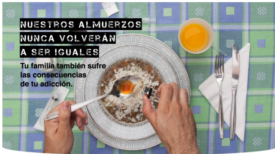
227.000 personas en Medellín y el Área Metropolitana consumen sustancias psicoactivas ilícitas