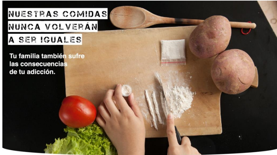
Medellín es la ciudad de Colombia con mayor índice de consumo de sustancias psicoactivas ilegales.