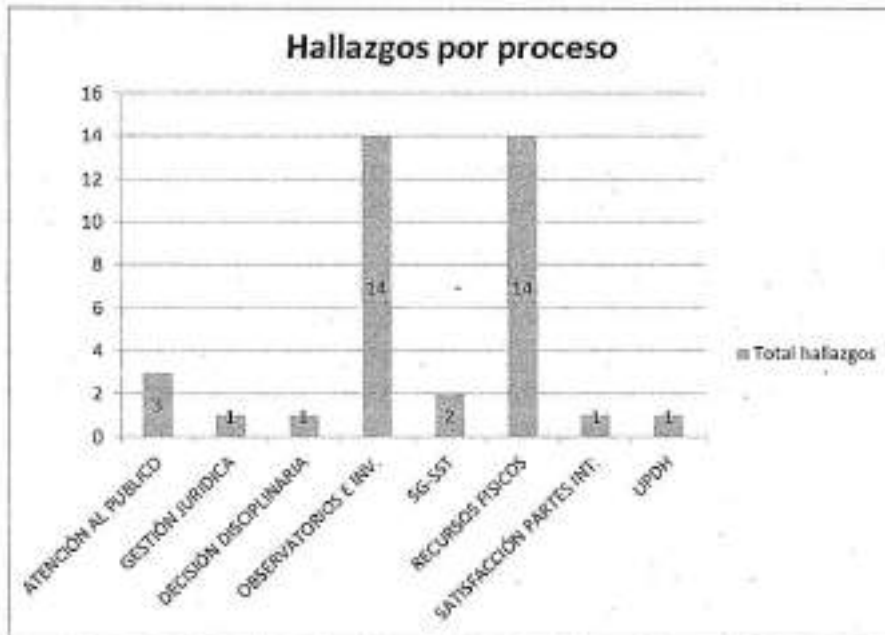
Gráfico 1: Hallazgos por proceso

A continuación, presentamos gráfico en el cual se indica el número de hallazgos por procesos, los cuales en su totalidad suman 37: